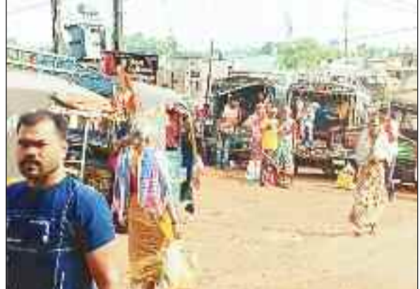
सड़क में खड़ा ऑटो।

प्रशासन ने पुराने संजय टाकीज के सामने ऑटो स्टैंड के लिए निर्धारित किया हुआ है। ऑटो वाले तो कहीं भी किसी भी जगह पर ऑटो रोक कर खड़े हो जाते हैं। ऑटो चालक सन्ना रोड में नया स्टैंड बना