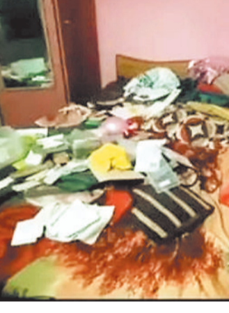
चोरी के बाद घर में बिखरा सामान।