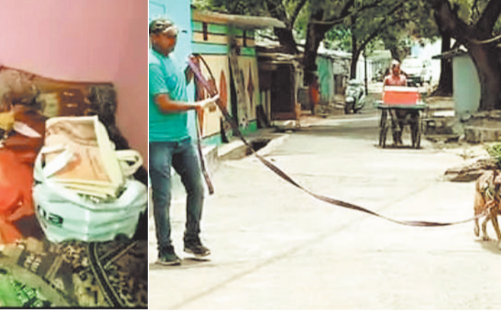
खोजी डग की मदद लेते पुलिस कर्मी।

हरिभूमि न्यूज ►► कोरबा मानिकपुर पुलिस चौकी क्षेत्र में सतनाम चौराहा के पास एक मकान का ताला तोड़कर चोरों ने आभूषण और नगदी रकम पार कर दी। वैवाहिक समारोह से लौटने पर एसईसीएल कर्मियों को इसकी जानकारी हुई। सूचना पर पुलिस की टीम मौके पर पहुंची और मौके का जायजा लिया। फिलहाल पुलिस मामले की जांच कर रही है।