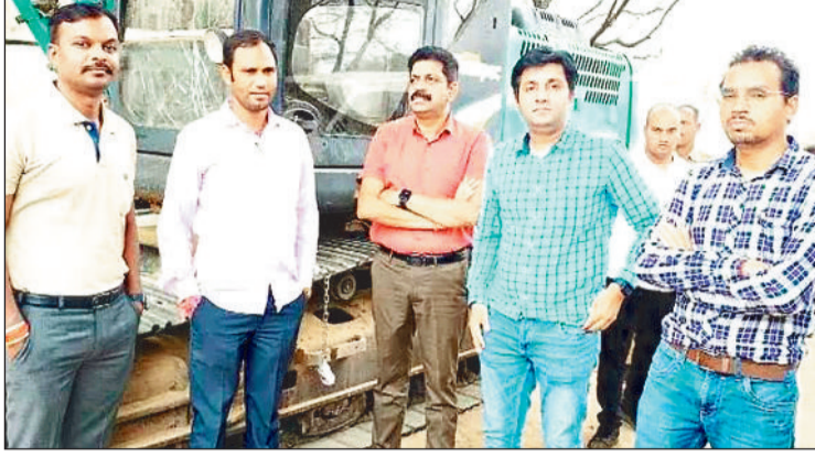
कार्रवाई करने पहुंचे खनिज विभाग के अधिकारी।