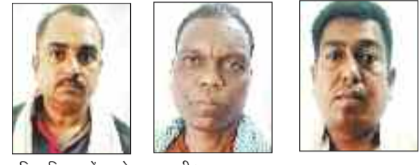
पुलिस गिरफ्त में पकड़े गए जुआरी।

शिकायत मिली। मुखबीर की सूचना पर पुलिस ने टीम बनाकर छापा मारा। पुलिस की इस कार्रवाई में तीन जुआरियों को गिरफ्तार करने में पुलिस को सफलता मिली। मौके से पुलिस ने 40,370 रुपए, 2 मोबाइल, 2 बाइक इत्यादि जब्त किया है।