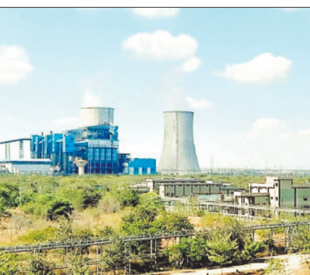
मड़वा संयंत्र में पर्याप्त कोयले की आपूर्ति नहीं होने से संयंत्र प्रबंधन द्वारा एसईसीएल प्रबंधन से कोयला आपूर्ति की मांग की गई। जिसपर एसईसीएल प्रबंधन ने बिना अनुबंध के लिफ्टेज के दर पर कोयला आपूर्ति नहीं करने की बात कही थी। विद्युत कंपनी के अन्य संयंत्रों में अनुबंध के मुताबिक एसईसीएल द्वारा निर्धारित लिफ्टेज के दर पर कोयले की आपूर्ति की जाती है। एसईसीएल प्रबंधन द्वारा निर्धारित दर पर कोयला आपूर्ति नहीं किए जाने पर आखिरकार विद्युत कंपनी प्रबंधन ने एसईसीएल को अधिक दर पर कोयला खरीदने की पेशकश की। जिसके बाद अब एसईसीएल से निर्धारित दर से 40 प्रतिशत अधिक दर पर कोयला खरीदा जा रहा है। सूत्रों की मानें तो एचटीपीपी संयंत्र में एसईसीएल कुसमुंडा प्रबंधन द्वारा 2 हजार पर मिट्टिक टन के हिसाब से कोयले की आपूर्ति की जाती है। वहीं मड़वा संयंत्र के लिए निर्धारित दर से 40 प्रतिशत अधिक दर पर कोयला खरीदना पड़ रहा है। अधिक दर पर कोयला खरीदी करने से उत्पादन कंपनी को आर्थिक नुकसान का सामना करना पड़ रहा है।

खरीदना पड़ रहा है। जिसकी वजह से विद्युत कंपनी को आर्थिक नुकसान का सामना करना पड़ रहा है। छग रायच विद्युत उत्पादन कंपनी के