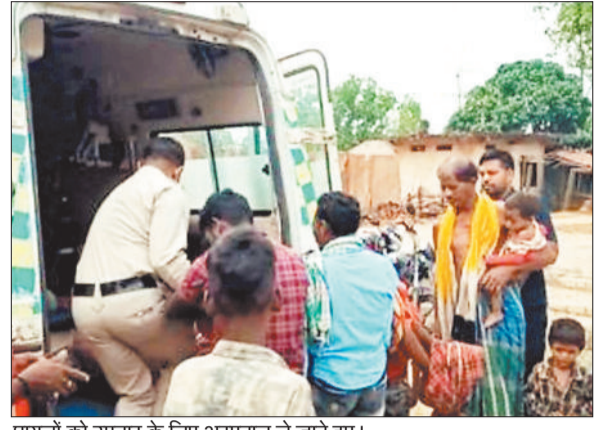
घायलों को उपचार के लिए अस्पताल ले जाते हुए।

हरिभूमि न्यूज ►► कोरबा बालको थाना क्षेत्र अंतर्गत ग्राम टापरा के जंगल में तेंदूपत्ता तोड़ने गई महिलाओं पर भालू ने हमला कर दिया। जंगल में दो भालू के हमले में महिलाएं गंभीर रूप से घायल हो गयीं। जिन्हें उपचार हेतु जिला अस्पताल ले जाया गया है। जानकारी के अनुसार कुछ ग्रामीण महिलाएं तेंदूपत्ता तोड़ने के लिए जंगल की ओर गयी थीं। इसी बीच एकाएक भालूओं ने उन पर हमला कर दिया, उक्त भिड़ंत में महिलाएं