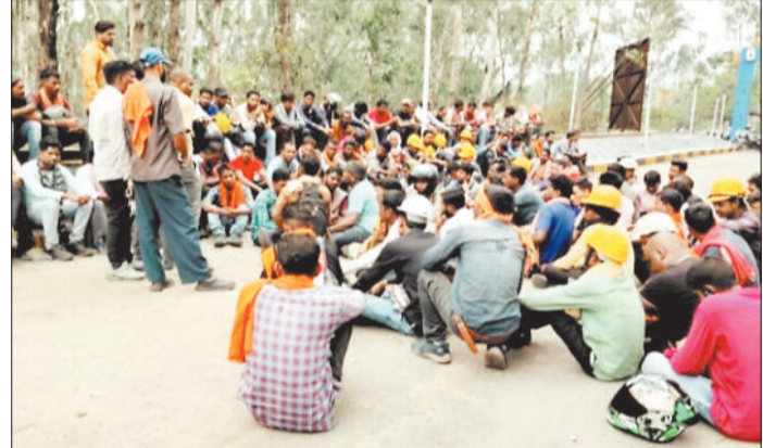
जीएम कार्यालय के बाहर धरना प्रदर्शन करते रूंगटा कंपनी के ठेका श्रमिक।

हरिभूमि न्यूज ►► कोरबा एसईसीएल गोवरा में कार्यरत आउटसोर्सिंग कंपनी रूंगटा के कर्मियों ने काम बंद कर जीएम कार्यालय का घेराव कर दिया। ठेका श्रमिकों का आरोप है कि रूंगटा कंपनी अपने वर्कर्स को केंद्र सरकार द्वारा निर्धारित दर पर वेतन भुगतान नहीं किया जा रहा है। कंपनी द्वारा आधा वेतन खाते में और शेष राशि नगद दी जा रही है। 25 हजार प्रतिमाह के वादे के विपरीत वेतन भी कम दिया जा रहा है।